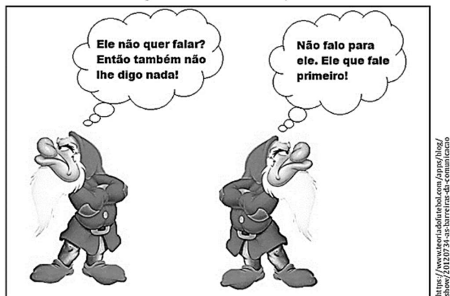
Figura 18 - Barreira de comunicação

A fim de evitar ou superar a barreira na comunicação educacional acima demonstrada, é primordial, inicialmente, aceitá-la e detectá-la a partir do desenvolvimento da percepção para só assim, conseguir uma comunicação eficaz. No caso acima, a atitude mais assertiva é: