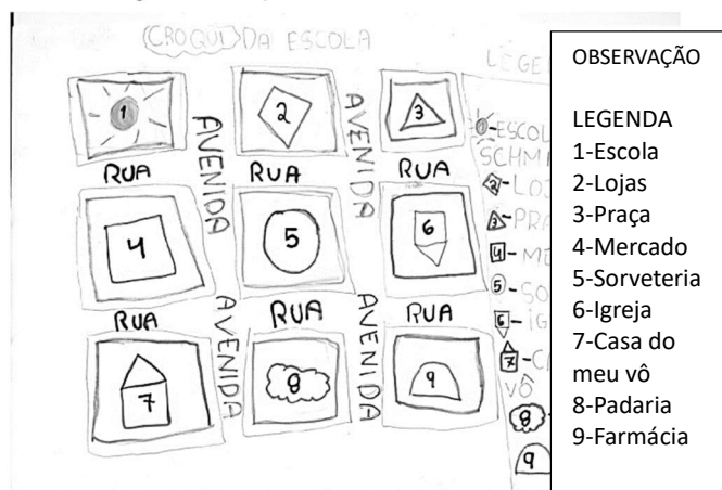
Figura 07 - Croqui do Centro destacando a escola

24) Analisando o desenho abaixo, nota-se que a aluna se utilizou de diferentes signos para representar os pontos de referência que a interessam, introduzindo, assim, a legenda como tradução de suas informações. A experiência com os locais de vivência fica evidenciada pela legenda que traz além da sua escola, farmácia, sorveteria, igreja matriz e, principalmente, a casa de seu avô.